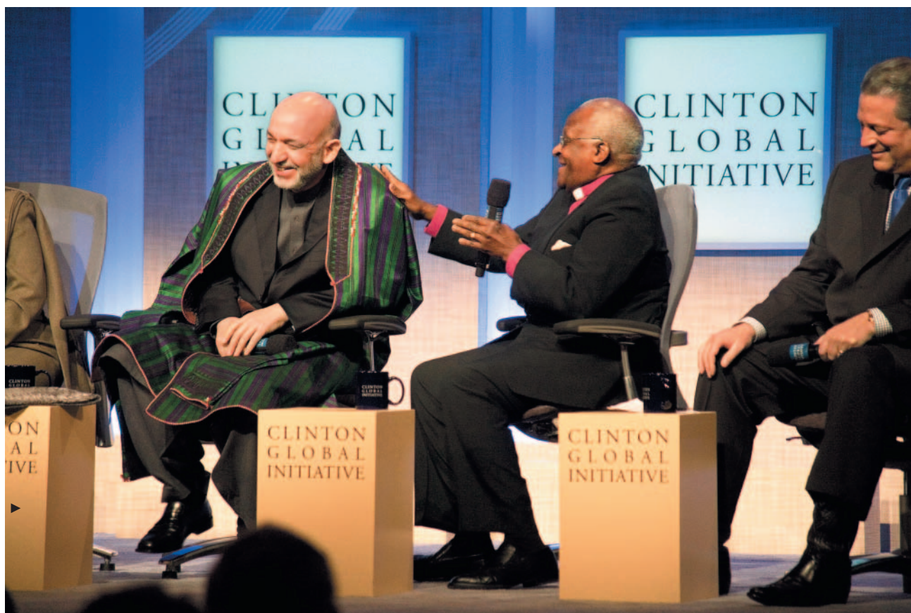
Hamid Karzaï, l'archevêque Desmond Tutu et Al Gore. « Nous devons aider Dieu à réaliser son rêve », espère le second. Dans les couloirs de l'hôtel Sheraton. Ici les gens cherchent des « opportunités d'affaires pour changer le monde », comme le souligne un participant.