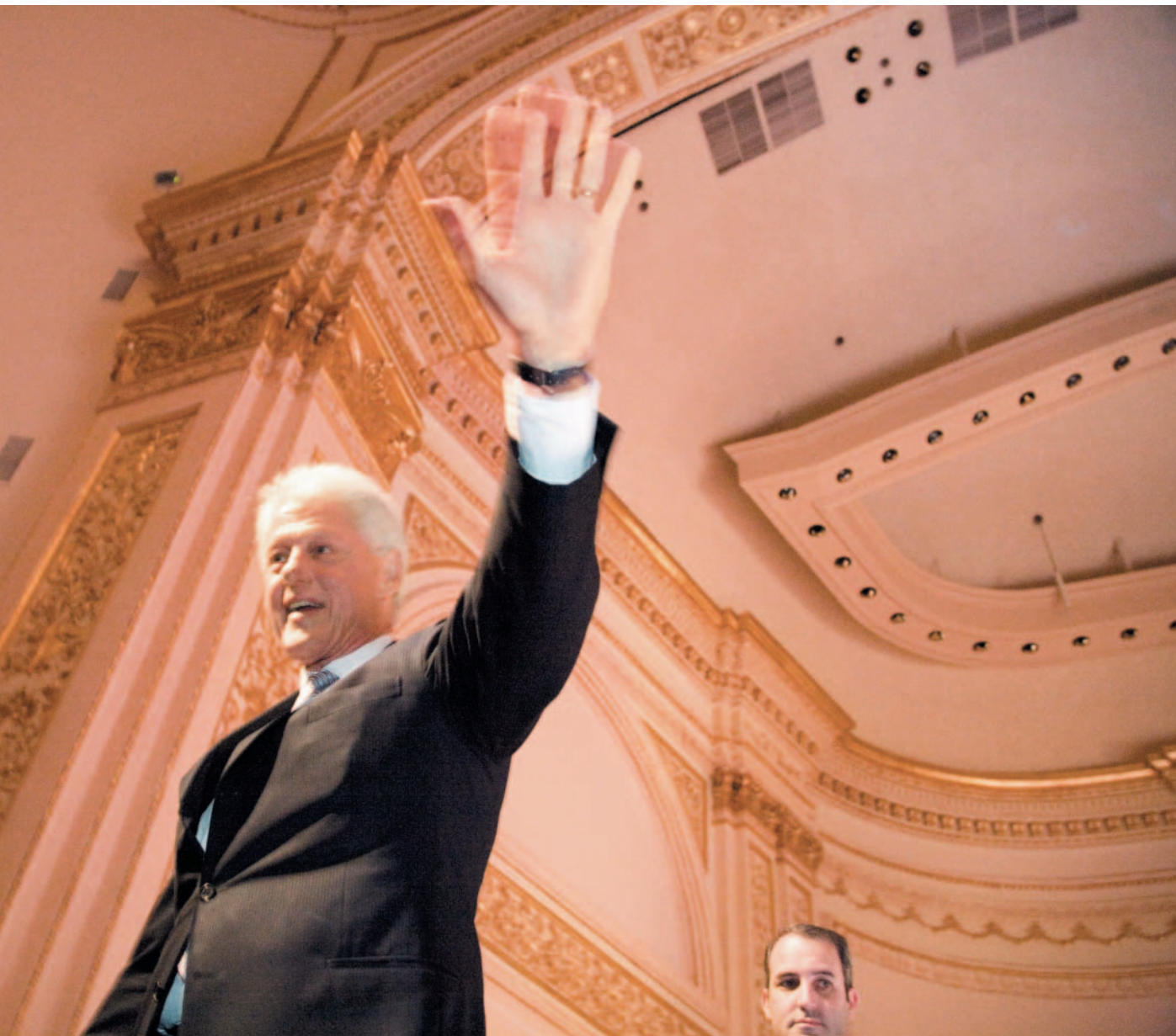
Le héros. « Je le dois au monde et à mon pays » : Bill Clinton salue la foule lors de la cérémonie des Clinton Global Citizen Awards, le 27 septembre, à New York.

grande salle de bal sur la bande originale de La Guerre des étoiles . Les pays d'Amérique latine, d'Afrique et d'Asie ont fait le déplacement. L'Europe moins. Bernard Kouchner et Martin Hirsch représentent la France, bien absente de l'événement. Bill Clinton s'avance vers le pupitre. Standing ovation . Grave et drôle, il scande « notre humanité, notre responsabilité, notre pouvoir ». Compassion, conviction, communication, mantra du clintonisme, signature d'une louable envie d'exister. Il met la pression sur le monde des affaires, connaît bien la nouvelle donne mondiale : sur les 100 premières économies mondiales, 43 sont des entreprises. Institutions totales, « elles sont en avance sur les gouvernements », reconnaît Tony Blair.